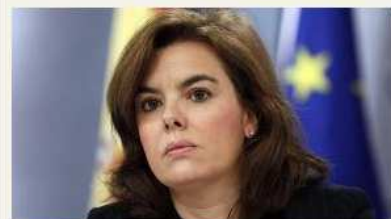
ECONOMIA El Gobierno asegura que no